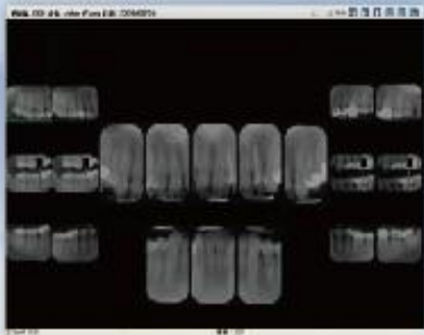
支持挂片协议及个人设定： 全口牙齿影像