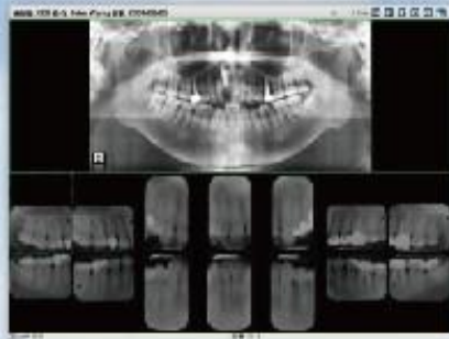
自定义设置： 全口影像+根尖片影像